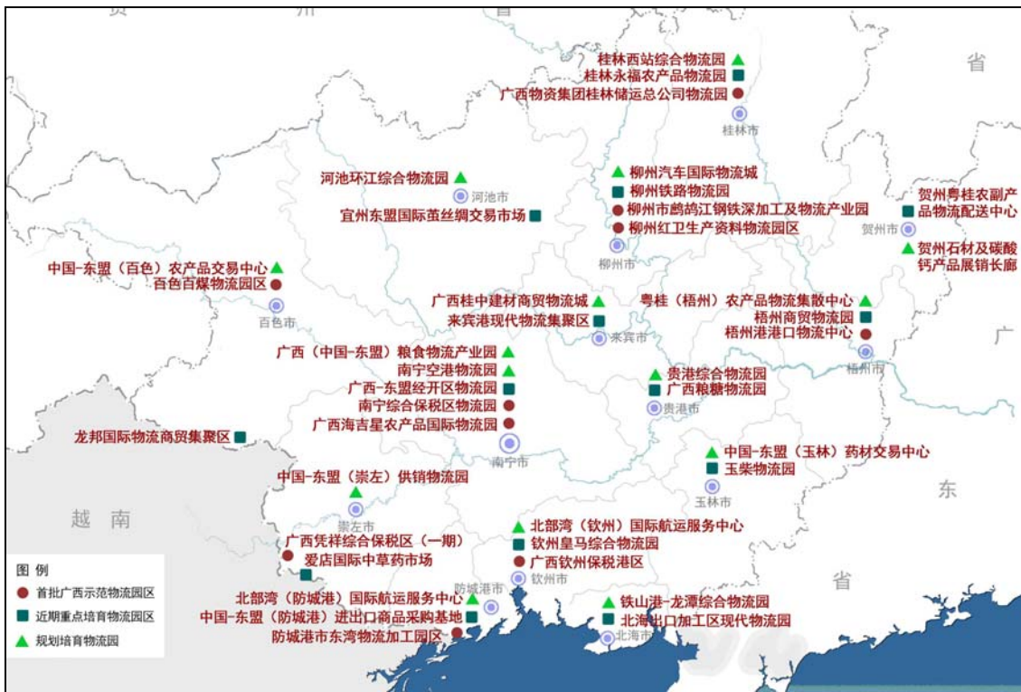
图3 广西示范物流园区分布图