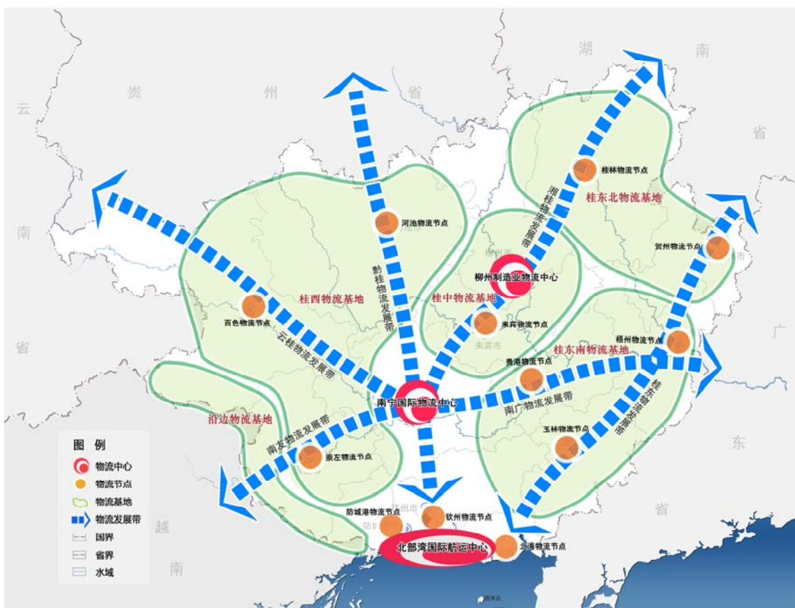
图2 全区物流空间布局图